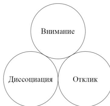
Рис. 1. Ключевые феномены гипноза.

Гипноз может значительно усиливать этот эффект и делать его более управляемым. С технической точки зрения механизм фасилитации идеодинамического эффекта был описан Эриксоном и Росси [9], который подразумевает 1) фиксацию внимания, 2) депотенциализацию сознательных установок, 3) бессознательный поиск, 4) бессознательные процессы и 5) гипнотический ответ. Независимо от конкретной технической реализации, результатом процедуры, которую мы называем гипнотической индукцией, является определенное состояние сознания, характеризующееся определёнными ключевыми феноменами, подробно описанными эриксоновскими авторами. Так, Зейг [26] описывает четыре феномена гипноза. Изменения во внимании и в интенсивности неразрывно связаны друг с другом: сфокусированное внимание вместе с углублением диссоциации естественным образом ведёт к повышению интенсивности того, что находится в фокусе внимания, и ослаблению «фона». Поэтому имеет смысл объединить их и выделить три ключевых феномена.