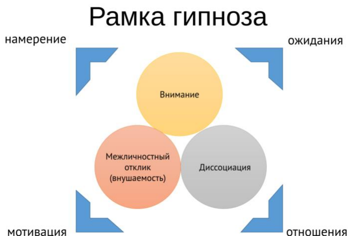
Рис. 2. Рамка гипноза.

Рамка гипноза – это набор межличностных и внутриличностных факторов, которые влияют на эффективность гипнотических техник. Психологические и социальные факторы регулярно упоминаются в качестве модулирующих факторов гипноза [13; 15; 18; 19]. Вместо рассмотрения по-отдельности когнитивных, социальных, контекстуальных и других переменных с практической точки зрения для удобства и наглядности выделим четыре ключевых фокусных точки, которые объединяют в себе связанные психологические и социальные факторы.